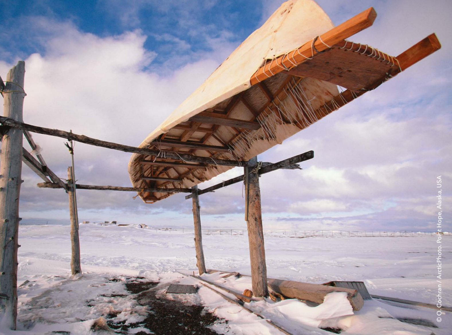
Point Hope, Alaska, USA

이 지역에서 석유/가스, 암석 채광과 관련된 채굴 산업은 공공분야를 제외한 주요 고용 부문이다. 현금 경제에서 광산업은 특히 축치자치구에서 전체 일자리의 1/5을 차지할 정도로 두드러진다. 알래스카 전체 고용 인구의 1/3은 직간접적으로 석유/가스 산업과 관련되어 있으며, 이는 2천개의 일자리 혹은 알래스카 BCB 지역 전체 고용의 약 절반을 차지한다.