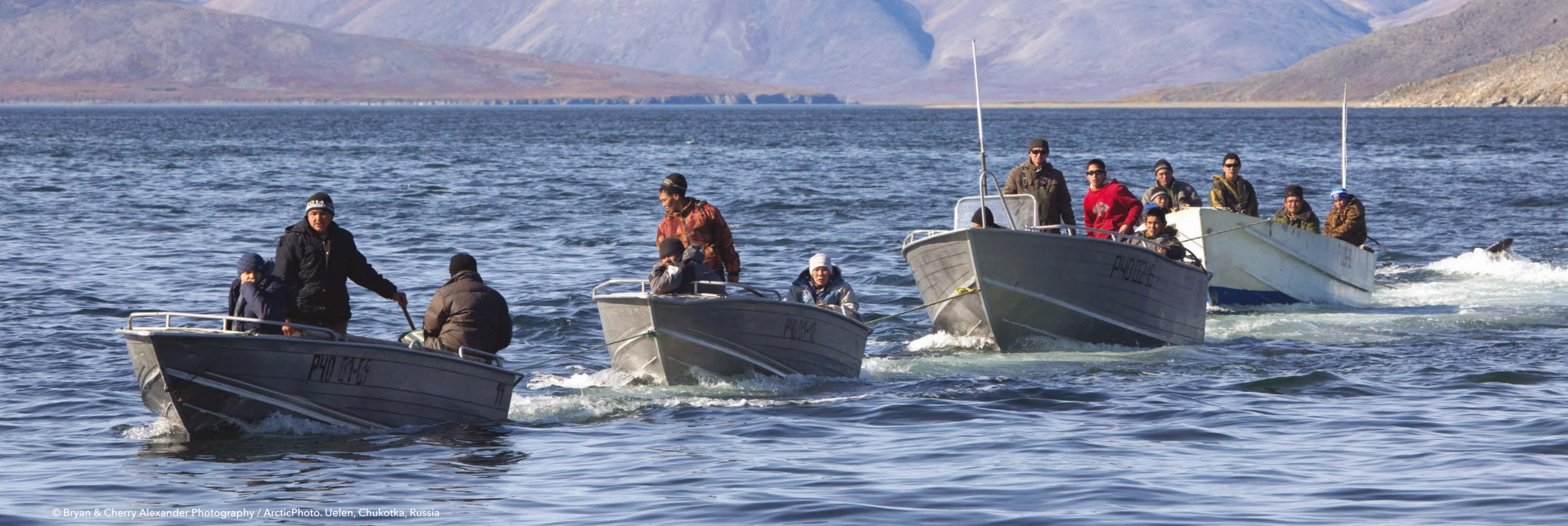
Uelen, Chukotka, Russia

다음은 베링-츠크치-보퍼트(BCB) 지역에 대한 AACA 과학 보고서와 이 개요 보고서에서 찾을 수 있는 것에 대한 요약 설명이다.