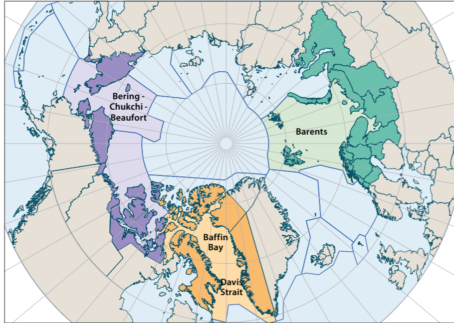
그림 1. AACA 시범지역

각 선정지역에 대한 보고서는 특정 지역에서 일어나는 변화의 현재 수준에 대한 논의와 함께 변화 유형과 상태에 대한 과학적인 평가, 그와 관련된 영향, 이러한 변화의 효과와 결과, 과거와 현재 및 미래를 제공한다. 과학과