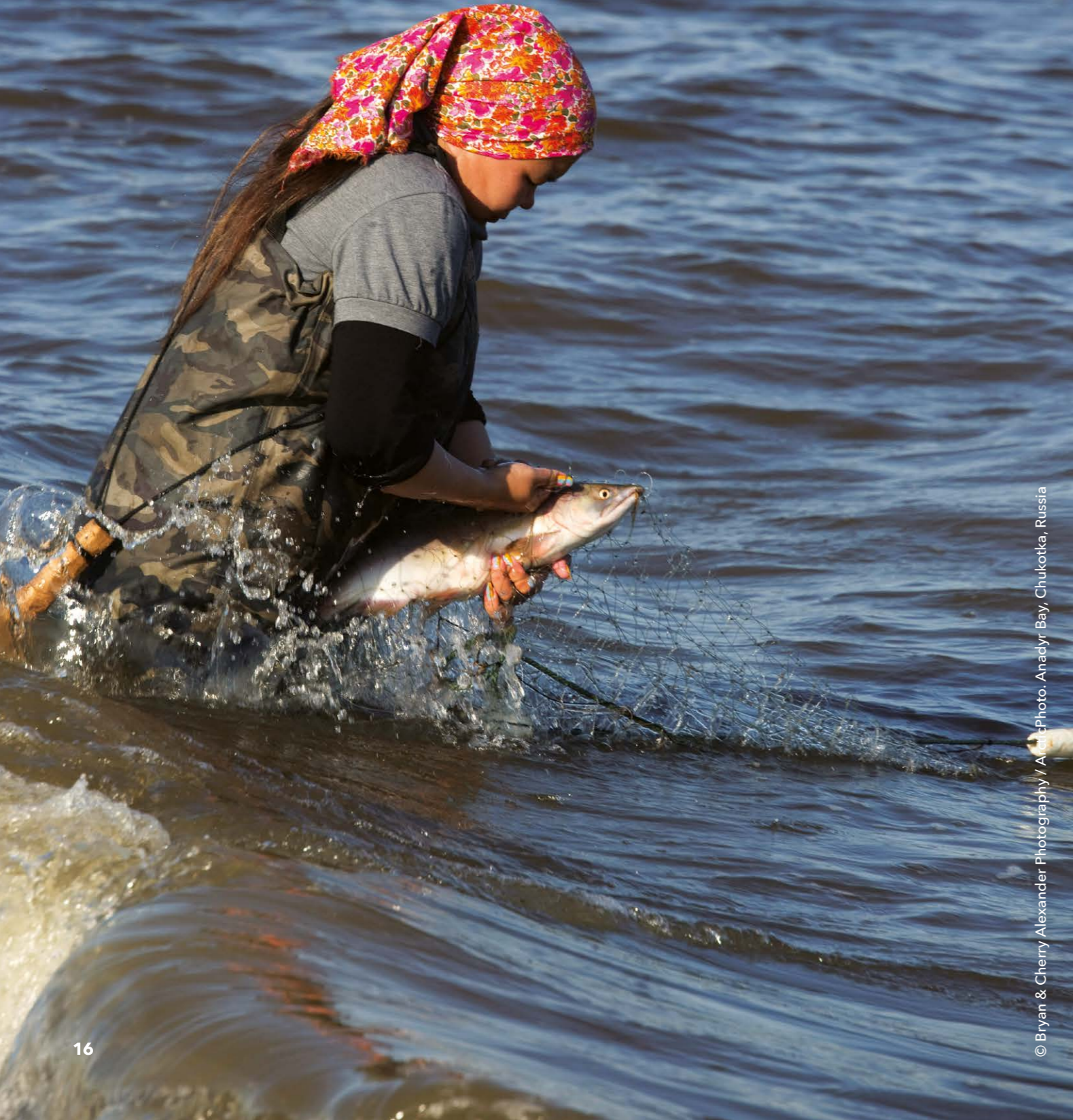
© Bryan & Cherry Alexander Photography / AlamyPhoto. Anadyr Bay, Chukotka, Russia

에드워드 썬도르, 전통 해양 포유류 사냥꾼 협회 러시아 축치자치구 사무국장