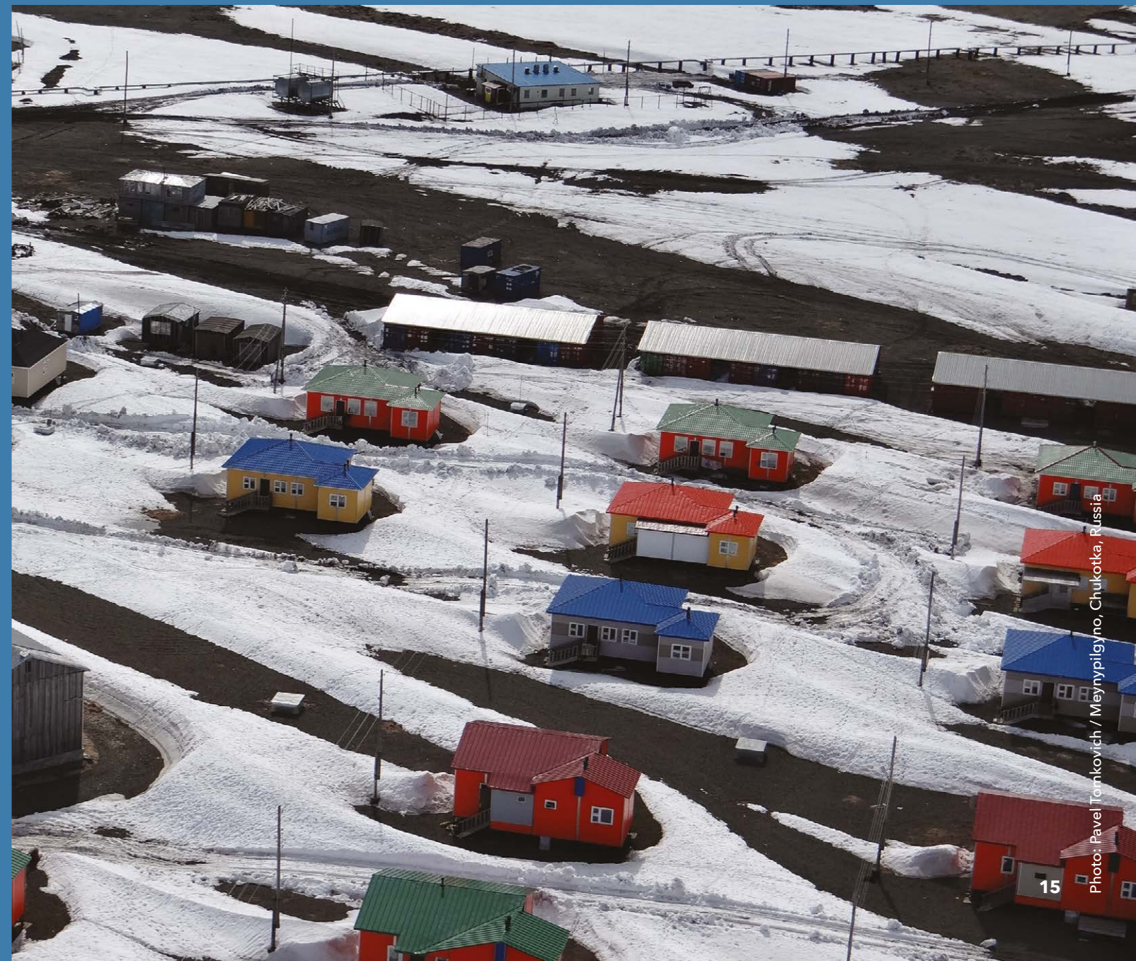
Meynypilyyno, Chukotka, Russia

그러나 식량 안보 불안정이라는 맥락에서, 지역 공동체가 자신의 가치, 우선 순위 및 생활 경험과 일치하는 적응 전략을 개발할 수 있도록 권한을 부여하는 것은 정부가 부과하는 지역 차원의 해결책보다 효과적 일 수 있다. 또한 적응 능력, 문화적 자존심, 자립을 지원하기 위하여 학교에서 전통적인 육상과 해양 지식, 사냥/낚시 기술, 원주민 언어 교육을 강화하는 강력한 사례가 있다.