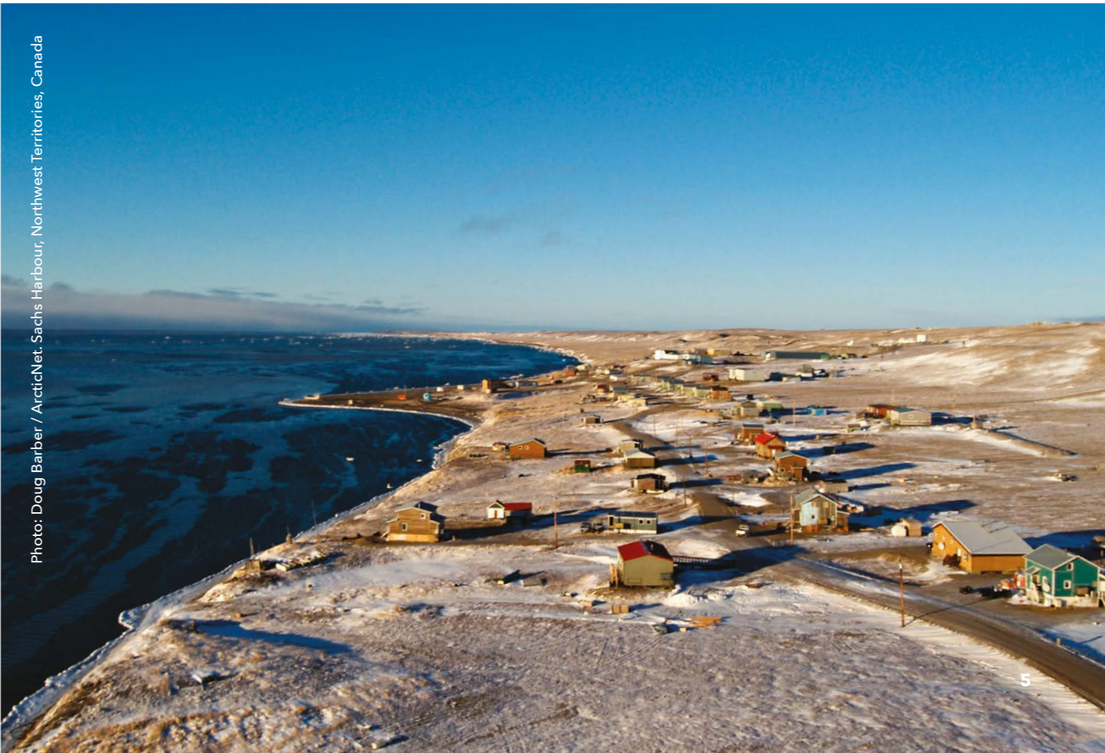
Photo: Doug Barber / ArcticNet, Sachs Harbour, Northwest Territories, Canada

본 평가는 적응 계획과 거버넌스, 그리고 지역사회의 참여에 관한 새로운 접근방식이 어떻게 미래 변화에 대해 개인과 지역사회가 성공적인 적응을 전망하는 것을 향상시킬 수 있는지를 기술하고 있다. 그러나 적응은 수용 가능한 변화의 속도와 강도면에서 분명한 한계가 있음을 주목하는 것이 중요하다. 기후 변화 속도를 늦추기 위해 전 지구가 온실 기체 배출을 상당히 줄이는 것은 반드시 지방과 지역의 적응 노력과 함께 진행해야 한다.