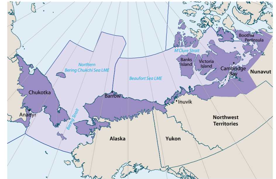
그림 2. 베링-축치-보퍼트(BCB) 연구 지역

툰드라 생태계는 저온, 적은 강수량, 빈영양, 짧은 성장 및 번식기간, 광범위한 영구동토에 대응하며 발달해왔다. 툰드라 지역 먹이 사슬에서 포유동물은 두 가지로 구분된다: 카리부와 순록, 돌산양, 사향소, 무스 등의 대형 초식동물과 이보다 크기가 작은 들쥐, 레밍, 북극얼룩다람쥐, 새앙토끼 등의 작은 초식동물로 나뉜다. 초식동물은 갈색곰, 북극곰, 늑대, 맹금류와 같은 밀도가 낮은 육식동물의 먹이가 된다.