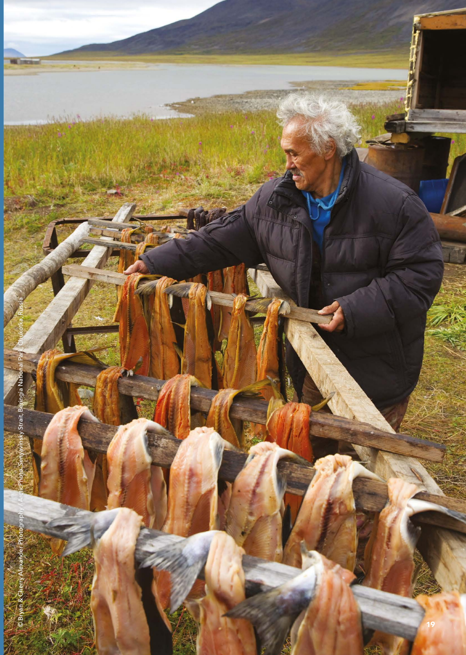
Senyavinsky Strait, Beringia National Park, Chukotka, Russia

북극이사회는 위험을 줄이고 증가된 지역 해운에 대비하기 위하여 적응 조치에 대한 여러 가지 권고안을 만들었다. 무엇보다도, 이 권고안은 국제 협력 증대, 국제해사기구(IMO)의 참여, 극지운항선박 안전기준(polar code) 승인, 전 지역에 걸친 거버넌스 통합, 안전과 수색 및 구조역량 강화, 지역민과 원주민의 해수 이용에 대한 조사 등을 포함한다. 일부 관광업 종사자들은 간소화된 거버넌스 부재, 특히 부담스러운 허가 요건에 대해 불만을 제기해 왔다.