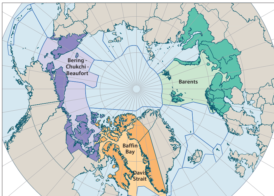
Рисунок 1: Три пилотных региона в рамках проекта «ААСА».

Каждый из трех региональных докладов представляет собой научную оценку типов и динамики изменений, протекающих в конкретных регионах, и включает обсуждение текущих уровней изменений, а также результатов, последствий и воздействия этих изменений в прошлом, настоящем