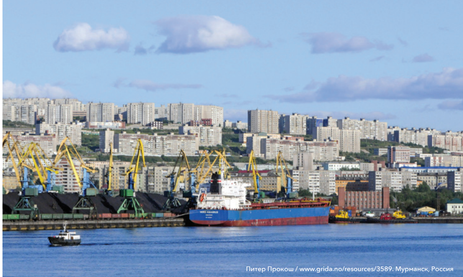
Мурманск, Россия