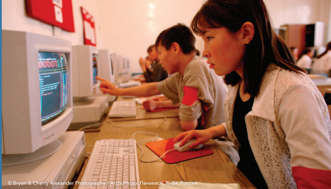
Панаевск, Ямал, Россия