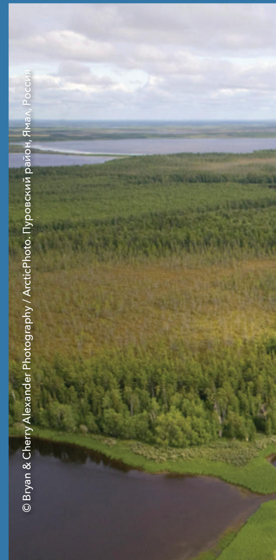
Пуровский район, Ямал, Россия

Для поддержки как местных, так и панарктических стратегий адаптации, основанных на фактах, можно разработать руководящие принципы, соответствующие местным условиям. Такие руководящие принципы должны начинаться с потребностей пользователей, отдавать предпочтение процессам, а не результатам, налаживать междисциплинарные и организационные связи, подчеркивать необходимость стабильной долгосрочной поддержки и учитывать необходимость гибкости, приспособляемости и обучения на опыте.