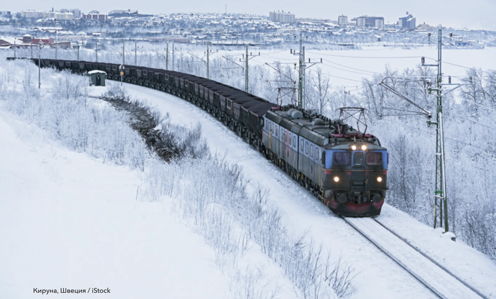
Кируна, Швеция

Сценарии, которые позволяют нам рассматривать разные гипотезы о том, как могут измениться текущие пути развития: к лучшему или к худшему. Сценарии широко используются для изучения будущего изменения климата и его воздействия в Баренцевоморском регионе. Они использовались для получения правдоподобной информации о том, как может измениться климат, основываясь на различных социально-экономических прогнозах. В последние годы масштабы климатических сценариев становятся все меньше. В докладе по проекту «ААСА» приводятся примеры того, как можно использовать «исследовательские» сценарии для оценки местных и региональных последствий глобальных тенденций. Исследовательские сценарии – это упрощенные, основанные на наборе предположений описание того, как может развиваться будущее.